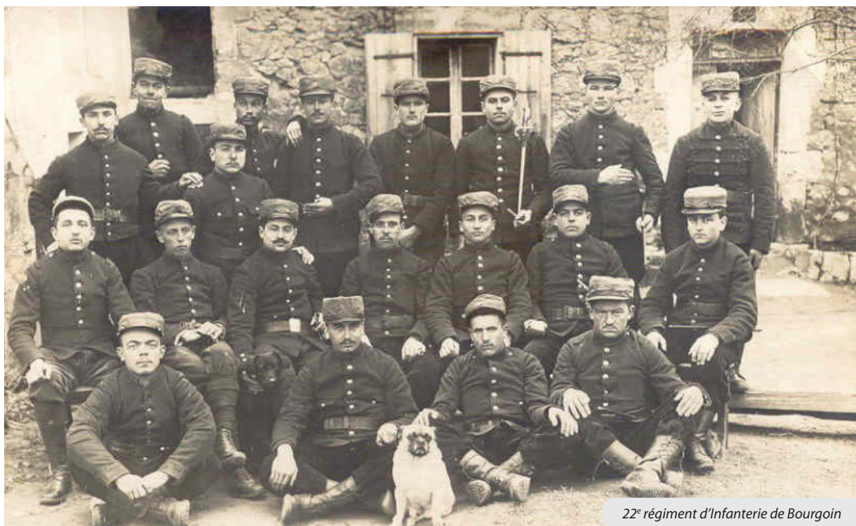
22 e régiment d'Infanterie de Bourgoin