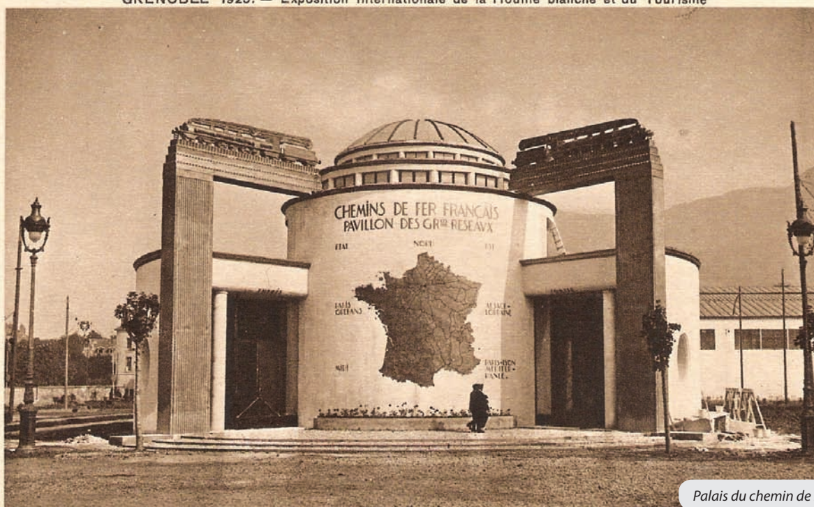
Palais du chemin de fer