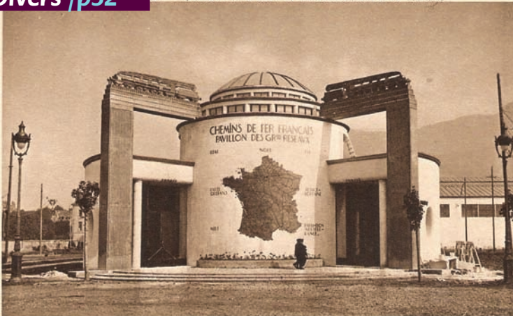
Chemins de fer français. Pavillon des Grands Réseaux

1935. — Exposition Internationale de la Houille blanche et du Tourisme