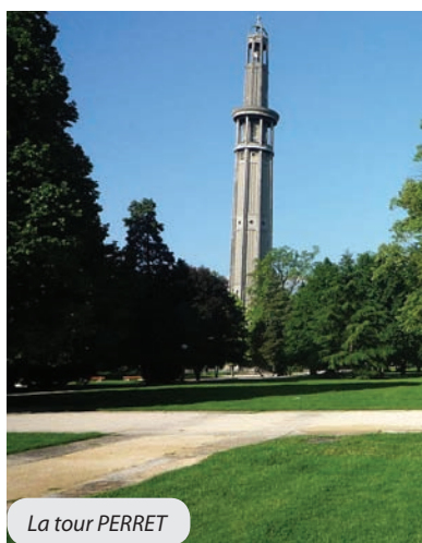
La tour PERRET

tant dans l'industrie de pointe (aviation, etc.) ou simplement par les ménages (qui n'a pas voulu à cette époque une casserole en aluminium...).