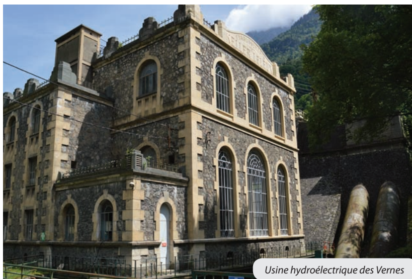
Usine hydroélectrique des Vernes

La houille blanche va se développer du sud au nord de notre département, avec le canal de Jonage : situé en grande partie sur les communes iséroises à l'époque, de Décines-Charpieu, Jons, Jonage, puis dans le département du Rhône, Vaulx-en-Velin et Villeurbanne, où est située l'usine hydroélectrique qui a sa mise en service (1899) est la plus puissante du monde (7 000 KW, plus que la production des 136 barrages situés en France en 1900). Cet ouvrage va pouvoir alimenter la région lyonnaise en électricité et assainir les plaines inondables de Miribel (Ain) et Vaulx-en-Velin, ce qui fera de cette dernière, la capitale du cardon*, dans les terres ainsi mises en valeur et aussi, contenir le Rhône de ses crues redoutables.