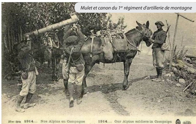
Mulet et canon du 1 er régiment d'artillerie de montagne

Le travail aux champs va échoir, faute de main-d'œuvre masculine, aux femmes, qui conduiront aussi bien les attelages pour faire les foins, les blés et récoltes de tous genres, aidées par ceux (peu nombreux) qui ont échappé à la mobilisation, ou par les anciens qui seront de bon conseil et qui ne rechigne-